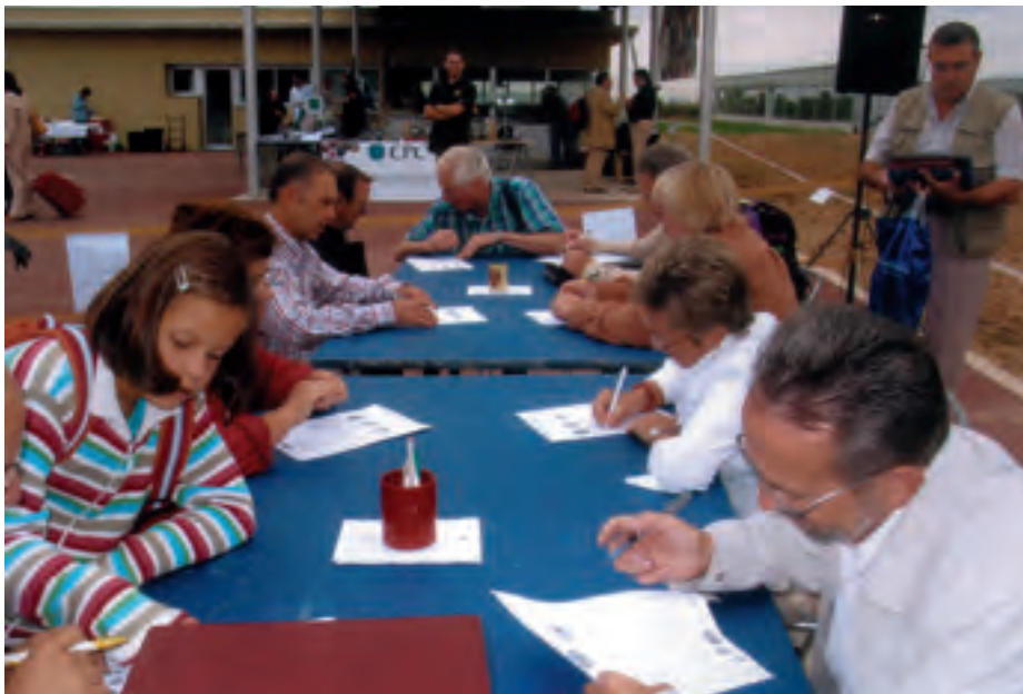
■ Diversos concursants en el joc del 3 x 3

També es va convocar el concurs de muntatges o construccions amb plaques de cava. Totes les obres que es van presentar estaven elaborades amb plaques de les mateixes caves Gramona, i les guardonades varen ser (tal com ja havia passat el mes de setembre en la Diada celebrada al Moll de