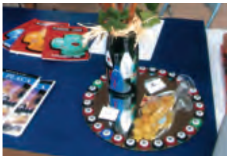
■ Alguns dels treballs presentats a la XII Mostra de Plaques de Cava a les caves Gramona