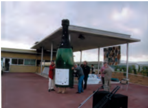
■ Pati de les caves Gramona, per on entren el raïm

Per a aquesta ocasió les noves instal·lacions de les caves Gramona ens varen obrir les seves portes per poder gaudir d'un matí que, tot i despertar-se una mica gris, va aguantar i fins i tot va escampar, permetent fer els intercanvis o els contactes amb vells amics i coneguts.